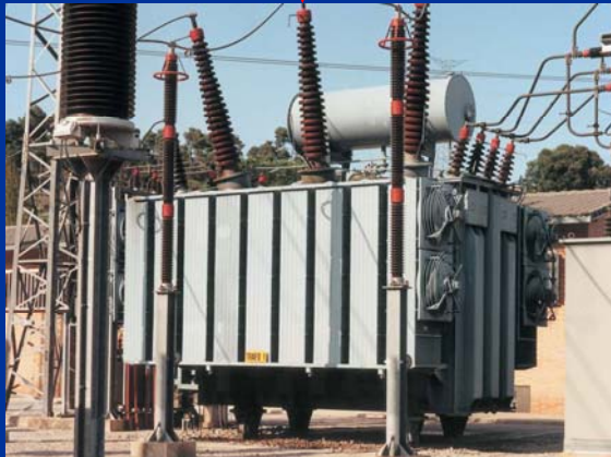
Transformador elevador de la central