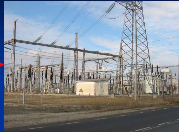
Subestación distribuidora y/o transformadora