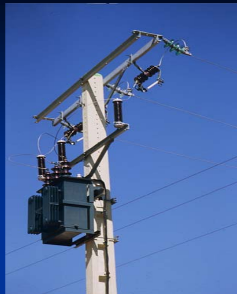
Centros de transformación intemperie o en edificio