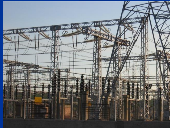
Subestación distribuidora en la central