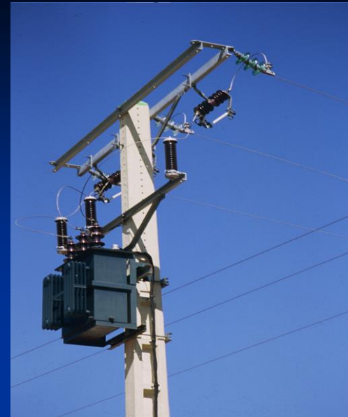
Centros de transformación intemperie o en edificio