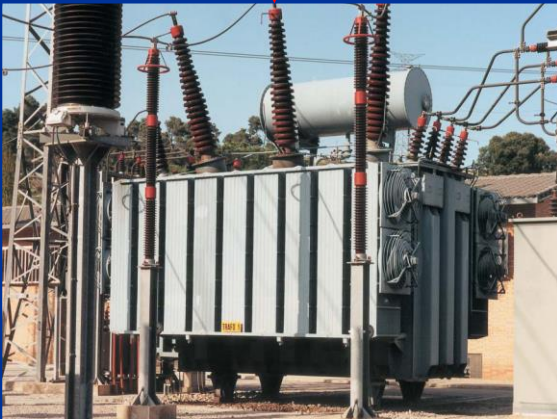
Transformador elevador de la central