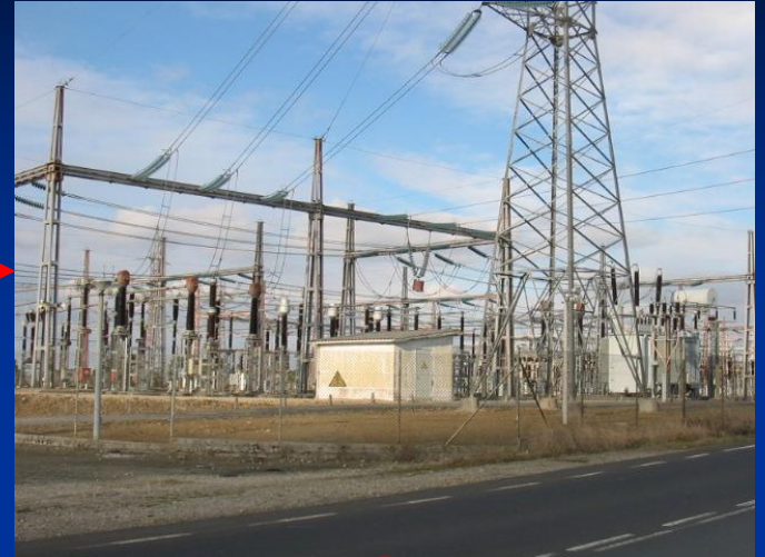
Subestación distribuidora y/o transformadora