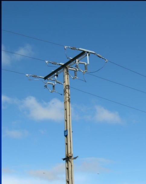
Líneas aéreas o subterráneas