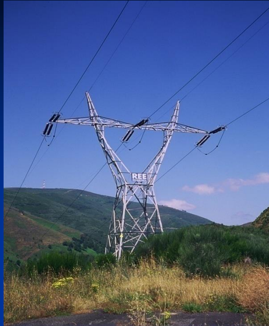
Línea aérea de transporte

A mayor tensión menor intensidad y por tanto menos pérdidas en las líneas de transporte.