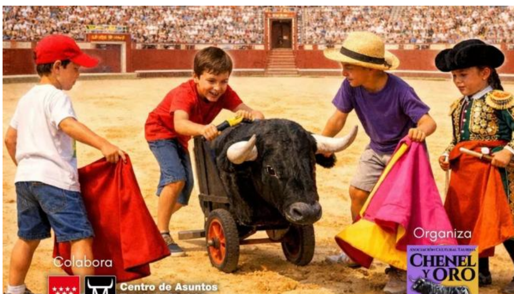
Cartel del día del niño en la plaza de toros de las Ventas (Madrid). Publicado por elDiario.es el 2026/05/01.

Días taurinos del niño, descuentos o escuelas para menores, tratan de fomentar una afición a la tauromaquia cada vez más exigua: PP y Vox compiten para utilizar políticamente un espectáculo al que han asignado el estatus de “manifestación de la españolidad”