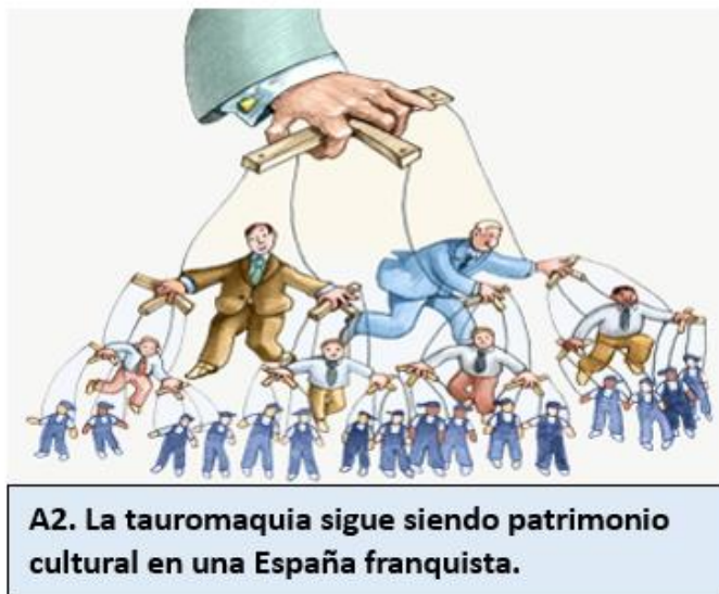
A2. La tauromaquia sigue siendo patrimonio cultural en una España franquista.

En este artículo indico, de forma resumida, varios temas sobre la tauromaquia, publicados por distintos medios de comunicación como el Diario.es.